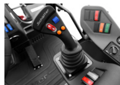
Nouveau joystick avec une fonctionnalité étendue