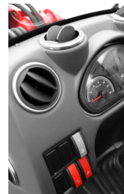
Autres sorties d'air plus grandes pour une circulation d'air optimale / série de commutateurs optimisée