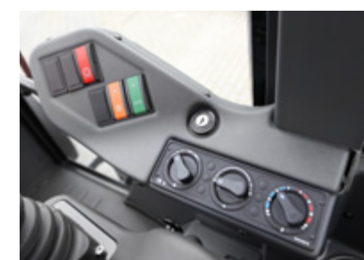
Nouvelle console: le contact, la commande de chauffage et la climatisation en option sont facilement accessibles.