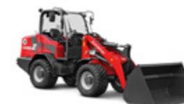
5680 Z 45 kW (61 CV) 55 kW (75 CV)