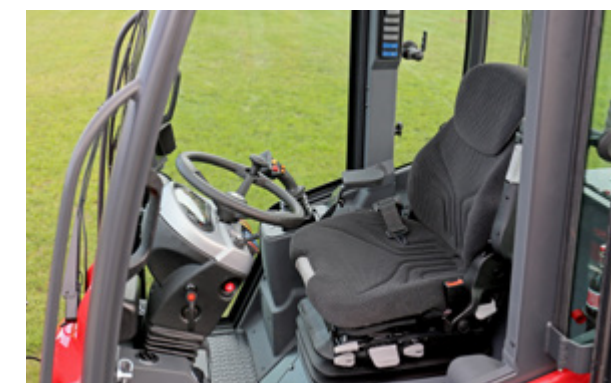
La nouvelle cabine offre plus d'espace et une visibilité optimale optimisée.

La 5680 Z est équipée en option d'un moteur turbo Deutz de 45 kW (61 CV) ou de 55 kW (75 CV). Il offre „plus“ de performance tout en restant compact. Avec cette chargeuse, le client bénéficie de la poussée et de la puissance de levage des plus élevées jamais délivrées par une chargeuse Schäffer 4 t. Cela apporte un plaisir de conduite sans compromis ! Le travail est fait rapidement, facilement et à peu de frais. L'essieu arrière pendulaire assure une stabilité absolue, même dans des situations de conduite difficiles.