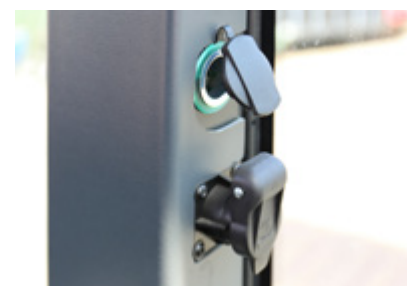
Prise de courant de 12 volts pour le chargement d'un appareil mobile / prise de courant pour appareil à 3 broches