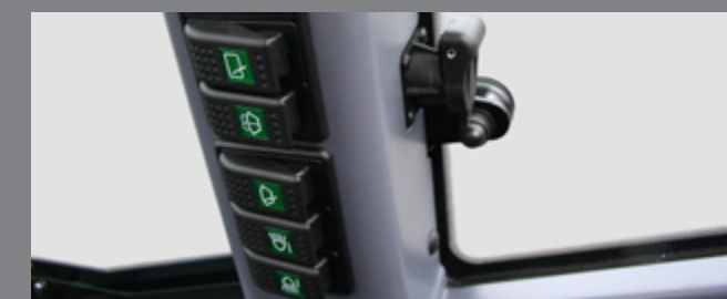
Interrupteurs regroupés – Prise 12V