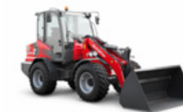
6680 Z 55 kW (75 CV)