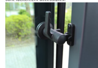
Vitres latérales ouvrables