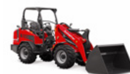
4670 Z 48,6 kW (66 CV)